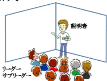
【リーダー研修は壁際で開催】

当日のスケジュールを共有します。広い会場の場合は説明者が壁を背にして立ち、説明を聞く側の集中力を高められるように工夫することが肝要です。近年では抗菌仕様のトイレも多く、従来のやり方と異なる場合がありますので、そのような重要事項はこの場でも説明します。そしていよいよ清掃実習となります。