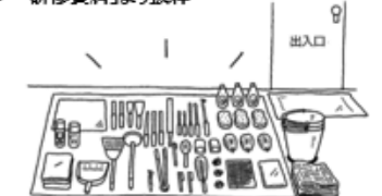
【よく使う道具は出入口付近に】