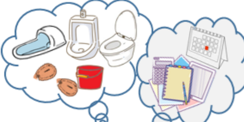
【現場状況、必要道具の確認と計画立案】