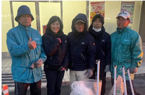
船橋駅前早朝清掃同志と 2024.12.17撮影 (筆者は向かって左から2番目)

すると、「毎日掃除するから続けられるんだよ」と笑顔での即答をいただきました。私は、「口をぽかーんと開け！はあー」と一瞬、何のことやら意味が分からず、とても意味深いお話となりました。