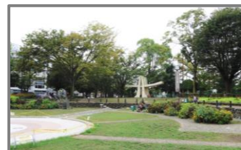
船橋天沼弁天池公園全景

また、来る三月の定時総会を経て、天沼弁天池公園、大神宮のトイレ掃除なども取り組めたら良いなと思っています。