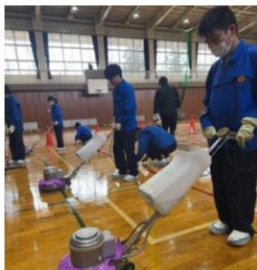
学校の床は自分たちの手で磨き上げる 2025年2月撮影

葉)」にも出場し、ビルクリーニング部門13回受賞、全国大会8回出場など「本気」で取り組んでいます。