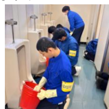
先輩から後輩に伝えることが大切 2024年12月撮影