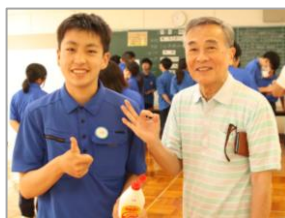
換気扇博士K君(左)とツーショット