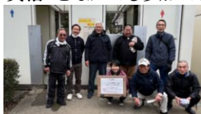
昨年の集合写真 2025.3.8撮影