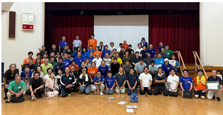
年次大会午前の部を終えて集合写真 茂原市総合市民センター4F大ホール 2025.9.13撮影

準備から当日までいろいろな場面で関わってくださった全ての皆様、茂原に足を運んでくださった全国の掃除仲間の皆様に、心より感謝申し上げます。